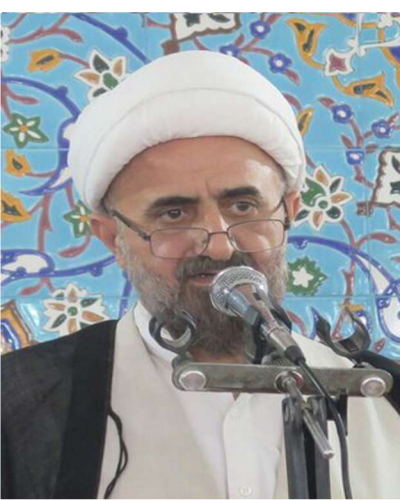
حجت الاسلام صفایی پور امام جمعه میامی: