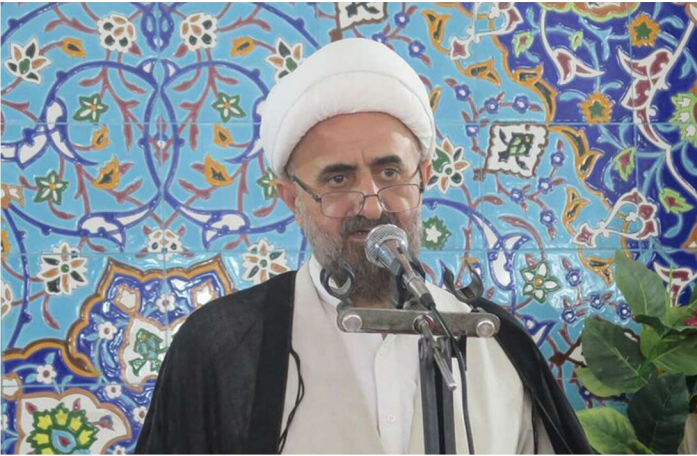
حجت الاسلام صفایی پور